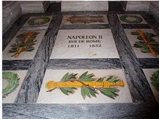
Het graf in Parijs

In 1940 besloot Adolf Hitler dat de resten van Napoleon II naar Parijs moesten worden overgebracht, net als honderd jaar eerder de resten van Napoleon van Sint Helena naar Parijs waren overgebracht. Ze werden aanvankelijk in de koepelkerk bij het Hôtel des Invalides onder het standbeeld van zijn vader Napoleon I begraven. Later werden ze verplaatst naar de crypte van de kerk. Hoewel het grootste deel van zijn resten werden overgebracht naar Parijs bleven zijn hart en ingewanden in Wenen achter, zoals gebruikelijk was bij Habsburgse vorsten. Het hart bevindt zich in urn 42 in de "hartcrypte" ( Herzgruft ) en zijn ingewanden worden in urn 76 van de hertogelijke crypte onder de Stephansdom bewaard.